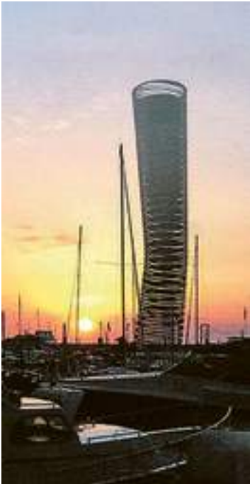
La torre di Fuksas