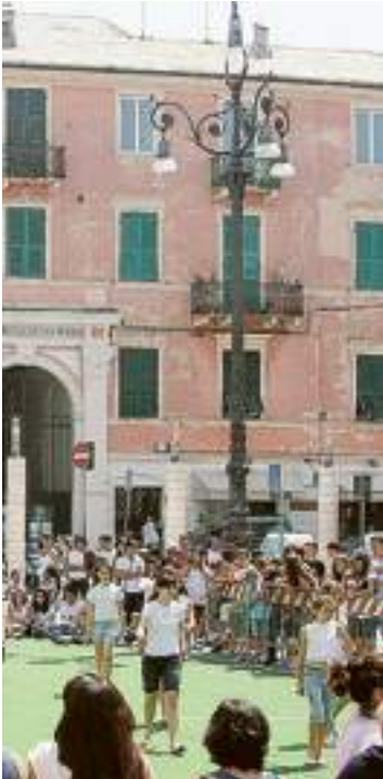
Piazza Sisto oggi è in festa

AFFARI IN ORO COMPRIAMO ORO Argento-Monete Oro-Dis. Polizze Pagamento Immediato Contante Massime Valutazioni Di Mercato ...SOLO NOI... ...LO PAGHIAMO DI PIU... Via Pietro Giuria, 25 F - SAVONA Tel. 019 4500422 - Cell. 349 4748375