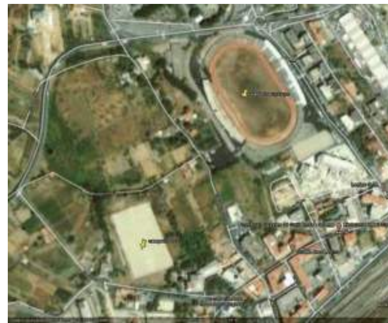
L'area di Legnino, in alto il Bacigalupo, in basso a sinistra il Csi