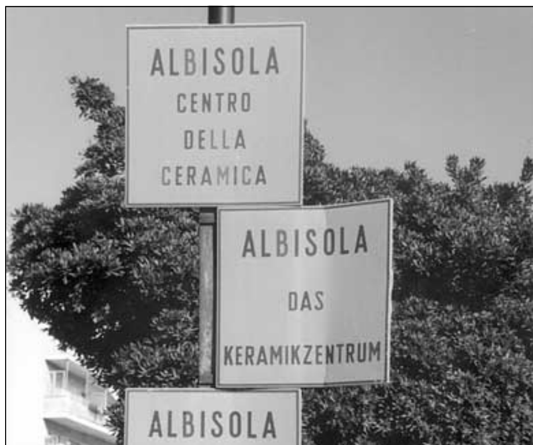
Un cartello forse profetico: era posto all'ingresso di Albissola Marina

A questo punto, i risultati sono a disposizione dei cittadini dei due Comuni e delle rispettive amministrazioni. È chiaro che non si tratta di una consultazione elettorale con tutti i crismi e che ovviamente chi intende mantenere invariata la suddivisione amministrativa e la denominazione delle