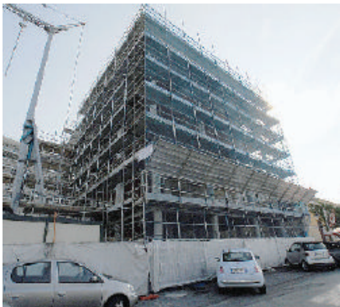
Per ora nella Darsena c'è solo il Cubo di Orsa 2000