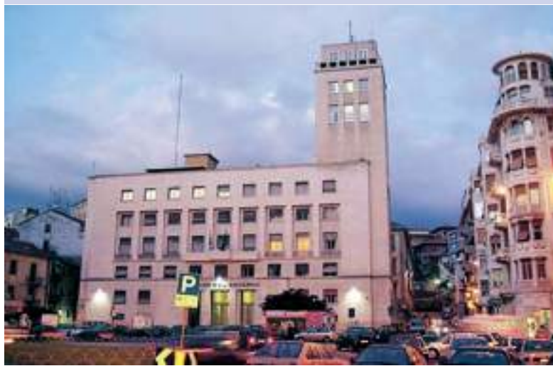
Il palazzo della Prefettura di Savona