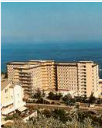
il complesso del San Paolo