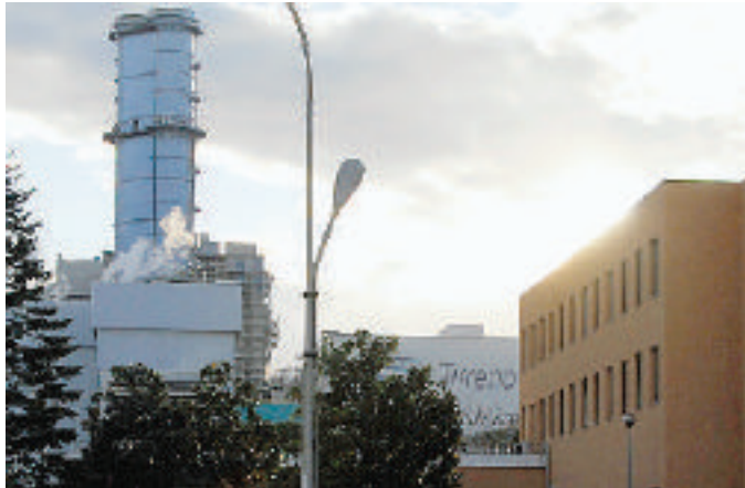
La centrale Tirreno Power sempre al centro del dibattito

Ed ecco quali sono le principali eccezioni portate dagli ambientalisti: «La non applicabilità dell'Art. 1 della Legge n° 55, su cui si basa il progetto del nuovo gruppo a carbone da 460 Mw presentato dalla Tirreno Power, in quanto in Italia non vi è urgente necessità di energia