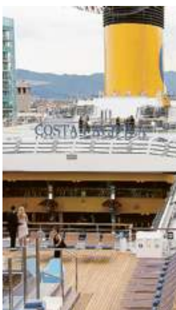
Il ponte della Pacifica