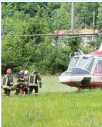
I soccorsi all'operaio ferito