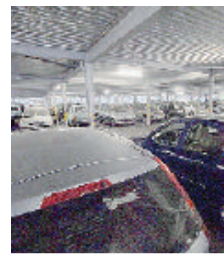
Il parcheggio di via Piave

Bollini per i residenti a Villapiana e tariffa notturna nel parcheggio di via Piave. Il Comune cambia la politica della sosta per far fronte all'emergenza che si sta verificando in città e in particolare nelle aree ex Italgas che sono diventate un posteggio stanziale anziché a rotazione. «Abbiamo riscontrato che il 92% dei posti auto è occupato in modo stabile e che quindi è venuta meno la rotazione delle auto in sosta prevista dai finanziamenti regionali che ci hanno consentito di realizzare il primo parcheggio in struttura della città - afferma Caviglia - A fronte di 356 posti auto abbiamo già 460 abbonati e quindi il parcheggio non può funzionare. Infatti i posti sono esauriti fin dalle prime ore della giornata.