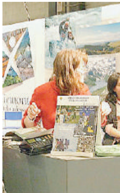
Uno stand della Borsa del turismo