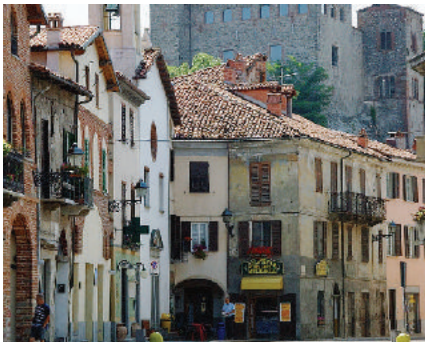
Anche a Millesimo si registra il segno +

Ad offrire questo articolato quadro sono i dati della Camera di commercio di Savona pubblicati online su Savona Economica, che sottolinea anche co-