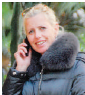
Frugoni della V Circoscrizione