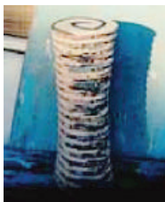
La bozza del progetto «5+1»