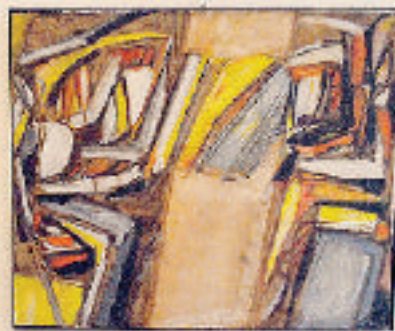
Una vita in mostra

Sopra «Immagine» del '54, a destra «L'albero e l'uomo» sotto da destra «Alberi gemelli» e «Riunione»