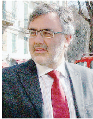
Il presidente Bertolotto

Il presidente della Provincia nella sua arringa cita una serie di dati: «Abbiamo 42 Comuni su 69 con la certificazione ambientale e siamo al quinto posto in Italia per infrastrutture, scuole, attività ricreative, dotazioni tecnologiche. Otto Comuni possono fregiarsi della Bandiera blu e altri 3 di quella arancione, abbiamo 5 presidi slow food e un movimento turistico da milioni di presenze l'anno. Tutto questo è avvenuto mentre Savona è uscita da una disastrosa crisi economica, sostituendo l'industria pesante con attività sicuramente meno impattanti sull'ambiente come turismo, porto e logistica».