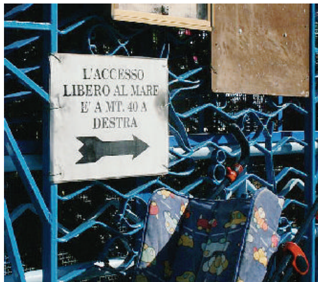
La nuova regola Il ministero obbliga i gestori e i proprietari di stabilimenti balneari a permettere l'ingresso a chiunque per raggiungere la battigia o il mare

Gli stabilimenti devono aprire l'accesso al mare. Qualcuno però fa ancora finta di non saperlo