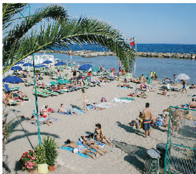
I rincari Gli ombrelloni secondo l'associazione dei consumatori costano il 2,4% in più rispetto al 2006, le sdraio sono aumentate del 7,6% e i lettini del 5%

un altro: «Ma adesso si sono adeguati alla legge anche quei colleghi».