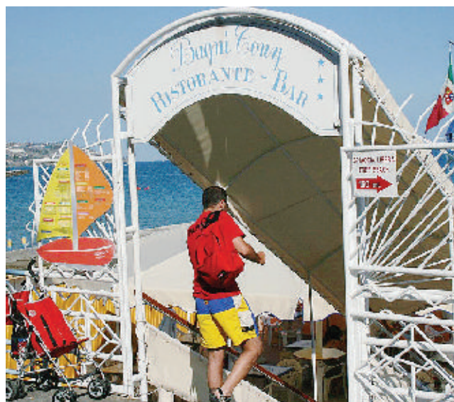
La minaccia Alcuni stabilimenti si adeguano, altri no. E c'è anche chi minaccia di non pagare più la concessione al Comune per protesta contro la circolare

Scatta il caro spiaggia. Quest'estate una giornata al mare può costare fino a 15 euro in più rispetto all'anno scorso. A calcolare i rincari delle tariffe degli stabilimenti balneari è il Codacons che ha realizzato una prima indagine a campione sulle tariffe applicate dagli stabilimenti balneari per la stagione estiva 2007, già iniziata in molte località di mare prese d'assalto dai cittadini durante i weekend. Si scopre così che i prezzi di lettini, sdraio e ombrelloni hanno subito ritocchi al rialzo, anche se di entità inferiore rispetto agli incrementi registrati negli anni passati. E se si aggiungono gli aumenti di gelati, bibite, panini, ecc. venduti sulle spiagge, e gli incrementi registrati nei prezzi dei carburanti, si arriva, appunto, ad un rincaro medio di 15 euro. Sulla base dei prezzi medi rilevati nelle principali località balneari, il Codacons ha calcolato che rispetto all'anno scorso il costo di un ombrellone è salito del 2,4%; quello di una sdraio del 7,6% e quello del lettino del 5%. Così, l'abbonamento giornaliero (1 ombrellone, 1 lettino, 1 sdraio) passa dai 16-18 euro del 2006 ai 16-20 euro del 2007 (+5,8%), mentre l'abbonamento stagionale sale dai 450-550 euro del 2006 ai 480-590 euro del 2007 (+7%).