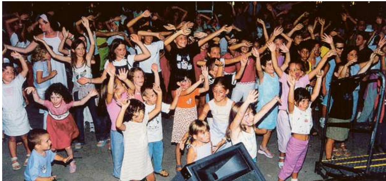
Baby dance, quest'estate, ad Alassio: una delle manifestazioni organizzate dall'assessorato comunale al Turismo

Prego... «Bene, da sindaco di Loano, anni fa, mi posi il problema delle dighe soffici, opere necessarie per salvare il nostro arenile. Battei letteralmente