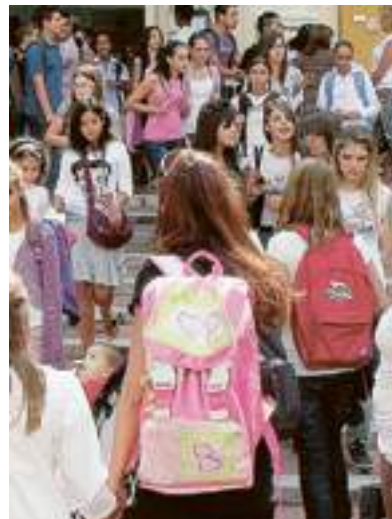
Primo giorno di scuola a Savona

Il gioco, poi, è anche un'occasione di aggregazione tra gli studenti. «Sono convinto che l'affiatamento tra gli alunni sia una cosa essenziale - conclude Gargano - E penso che questo gioco soffra anche l'opportunità