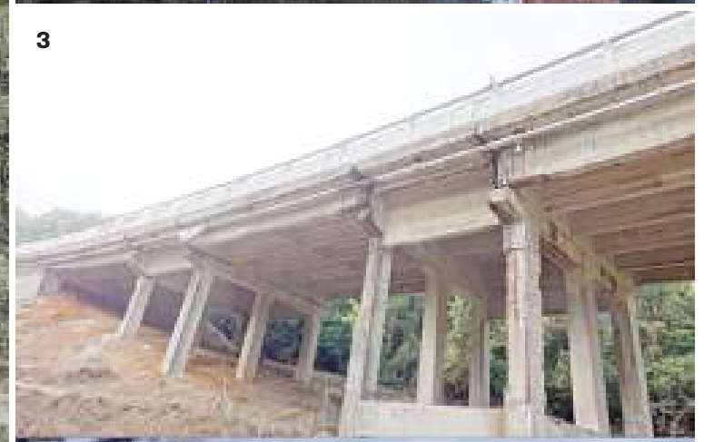
1) Un'immagine di Autofiori inerente il viadotto di Ferrania risalente al settembre scorso con i lavori in corso; 2) Nella foto di Genzano l'attuale situazione del tratto del viadotto A6 tra Ferrania e Lodo a lavori finiti; 3) Una delle foto contenute nell'esposto di Forzano alla Procura