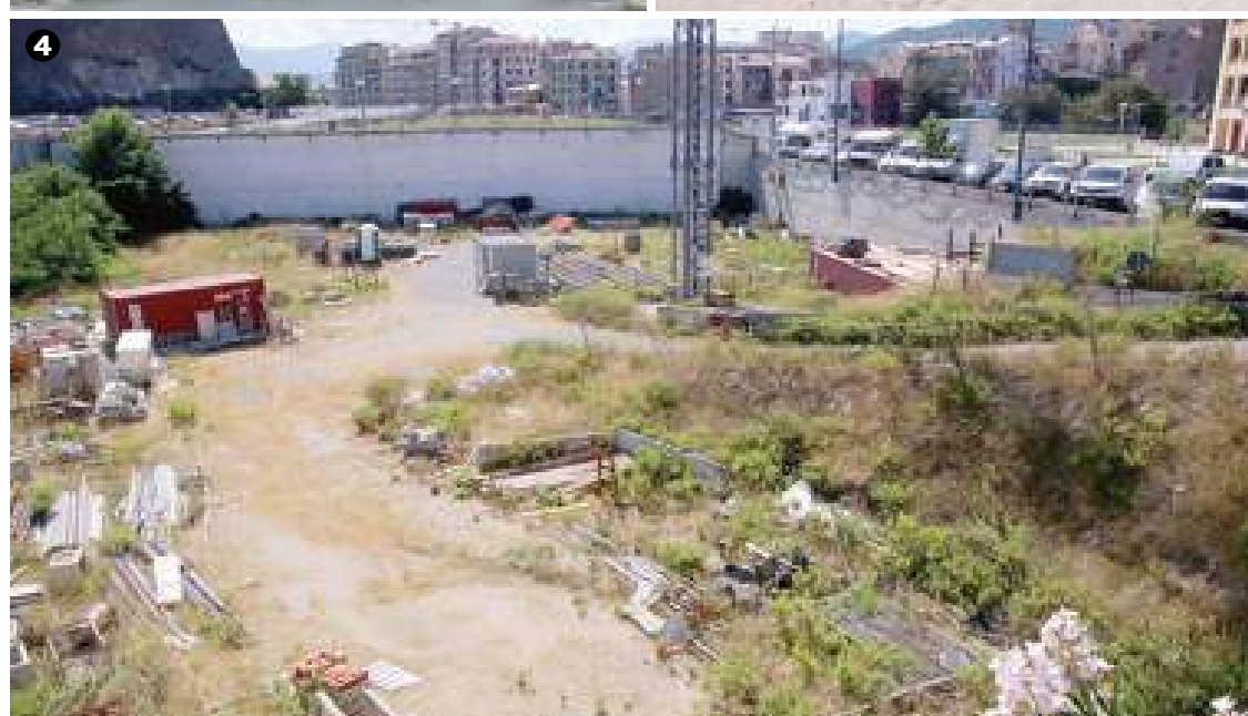
1) La spiaggia della Margonara al confine con Albissola; 2) Gli ex cantieri navali Solimano in via Nizza; 3) Il cantiere dell'ex ospedale San Paolo; 4) L'area dove dovrebbe sorgere il Crescent Due;