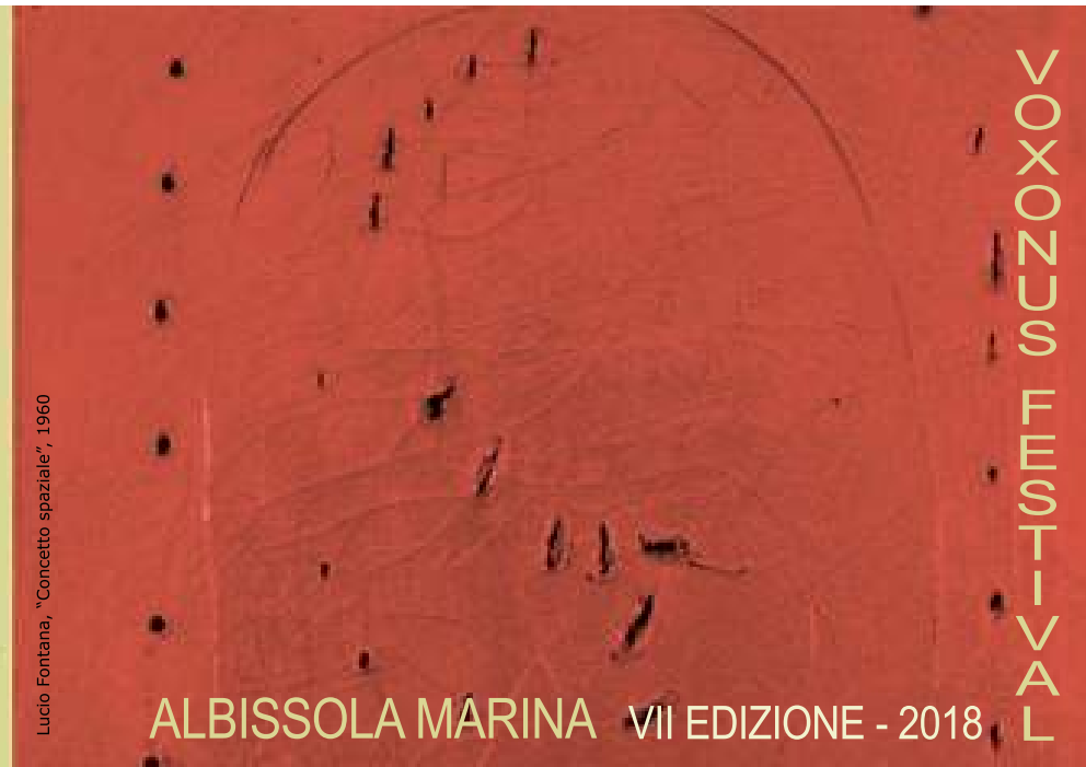
Lucio Fontana, "Concetto spaziale", 1960