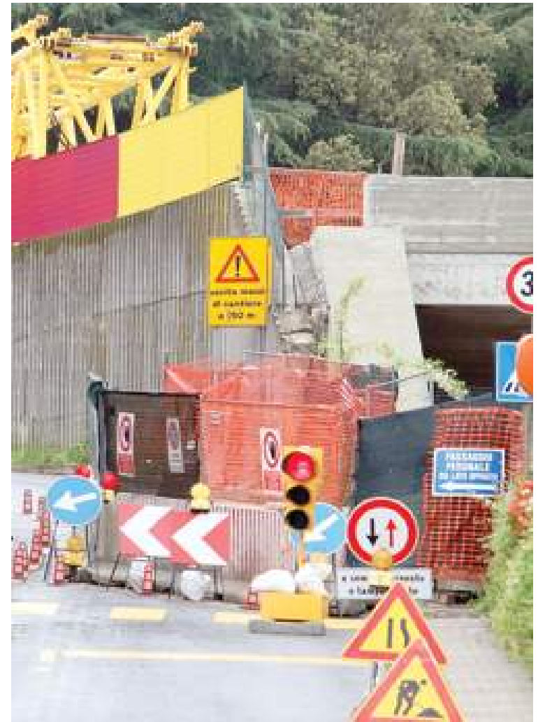
La viabilità rivoluzionata in via Mignone e Schiantapetto PUGNO

INCERTEZZA SULLA RIAPERTURA DEL SOTTOPASSO TRA VIA STALINGRADO E VIA NIZZA