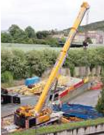
La maxi gru alla Rusca

via Mignone, via Istria e via Firenze. La maxigrù Terex-Demag CC6800, acquistata dalla Vernazza, sbarcata nelle scorse settimane nel porto di Vado ed installata nel piazzale vicino allo svincolo autostradale per i test, verrà allestita sulla piattaforma costruita allo sbocco della galleria “Cappuccini” in via Schiantapetto. La gigantesca struttura (in tutto il mondo ne esistono solo 13 esemplari), è in grado di sollevare 1250 tonnellate.