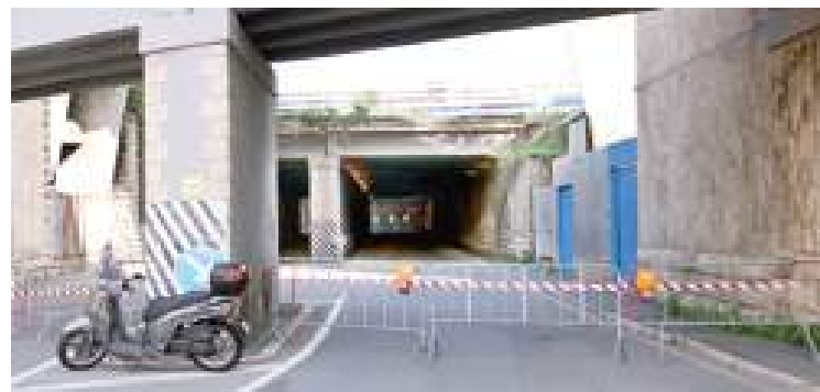
Il sottopasso di via Cilea chiuso al traffico per sicurezza PUGNO

Chiamati da alcuni passanti, i vigili del fuoco avevano effettuato un sopralluogo riscontrando che dal parapetto del passante ferroviario si erano staccati alcuni pezzi di into-