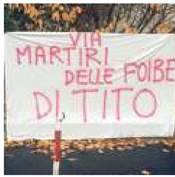
Lo striscione di Bragno

La motivazione del gesto alla luce della contestazione di "Stalingrado" (l'epica battaglia con cui l'Armata Rossa fermò l'avanzata dei nazisti), scelta toponomastica non ritenuta più al passo con i tempi dalla giunta Lambertini. Le-