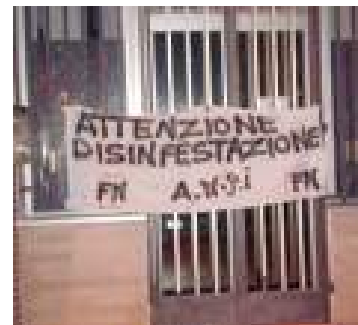
Sulla porta della sede Anpi