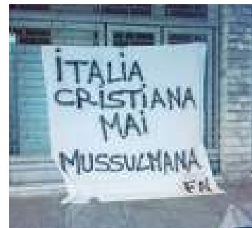
Davanti alla moschea