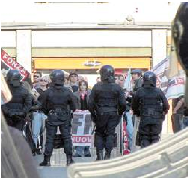
Manifestazione di Forza Nuova a Savona nel 2012