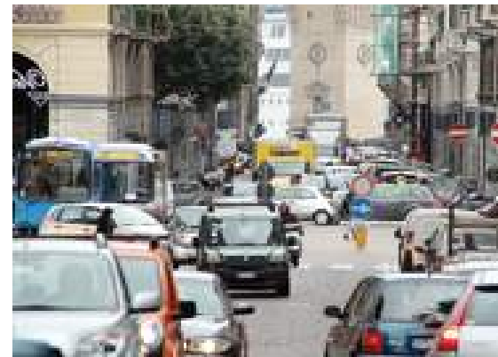
Via Paleocapa resterà aperta al traffico solo nella parte bassa: dalla Torretta a via Manzoni

zione. Il piano contiene altri aspetti. Tra questi la necessità di modificare le isole ecologiche, per evitare che la raccolta rifiuti causi blocchi nel traffico. La realizzazione di piste ciclabili più coerenti. Possibili soluzioni per il problema dei parcheggi a Villapiana. E, soprattutto, come collegare Savona con la futura Aurelia Bis.