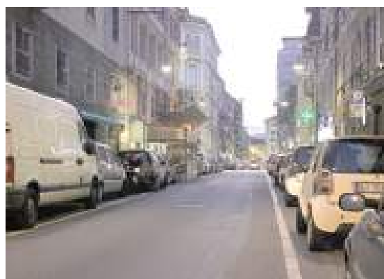
Via Giuria cambia senso di marcia, così come via Colodi e via Luigi Corsi

Il percorso avrà inizio alla stazione ferroviaria di Mongrifone e raggiungerà il centro storico attraverso via Colodi, via Luigi Corsi e via Pietro Giuria. La viabilità in queste strade dovrà essere invertita; si tratta del cambiamento più radicale previsto dal piano, motivato dalla necessità di "scaricare" corso Tardy & Benech e corso Mazzini dal traffico dei mezzi leggeri (traffico che è destinato ulteriormente ad aumentare con l'apertura dell'Aurelia