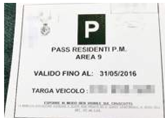
Nell'oasi pedonale sarà consentita la sosta solo ai residenti e per il carico e lo scarico

Questo permetterebbe di creare un'isola pedonale enorme che comprenderebbe piazza del Popolo, piazza Mameli e la parte alta di via Paleocapa fino all'altezza di via Manzoni. Proprio in queste strade potrebbe venir spostato il mercato del lunedì, senza disagi alla circola-