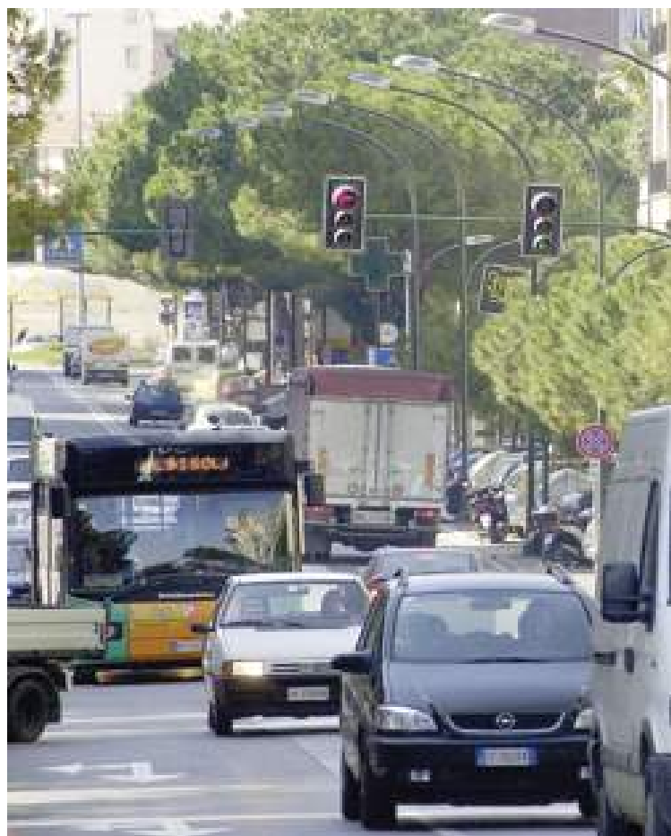
Nuovo tracciato ad anello per i bus della Tpl

Il piano si fonda su un concetto cardine: a Savona girano troppe auto. Serve quindi rendere più appetibili i mezzi pubblici e, in parallelo, disincentivare l'utilizzo di quelli privati. Il ragionamento parte dal presupposto che, oggi, solo il 17 per cento dei savonesi usa l'autobus. «Perché è scomodo - dice lo staff di Arecco - perché non consente di raggiungere i veri punti di interesse (ospedale, scuole, uffici) se non effettuando dei cambi e perché, troppo