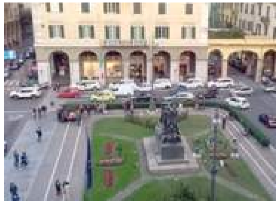
Piazza Mameli, piazza del Popolo e la parte alta di via Paleocapa saranno pedonalizzate

Bis). I bus continueranno la loro corsa in via Gramsci, poi saliranno in via Berlingieri (anch'essa invertita) e percorreranno via dei Mille, via Don Bosco, via Aglietto per tornare in stazione. Le corse non transiteranno più a orari