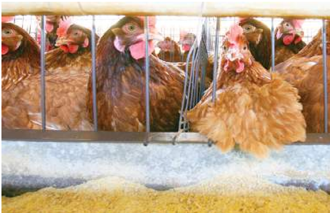
Un allevamento di galline

Dall'Asl 2 viene ribadito: «Nessun rischio per i consumatori, quantità Fipronil molto al di sotto della soglia tossicità». È quanto è stato diffuso dall'azienda sanitaria dopo che l'Istituto Zooprofilattico Sperimentale ha rilevato una quantità di Fipronil superiore al limite consentito «su un campione di uova fresche prodotte in un allevamento avicolo operante nel savonese e prelevato il 17 agosto scorso dagli esperti della ASL 2, nell'ambito dell'intensificazione dei controlli disposti dal ministero della Salute e dalla Regione Liguria». Lo comunica,